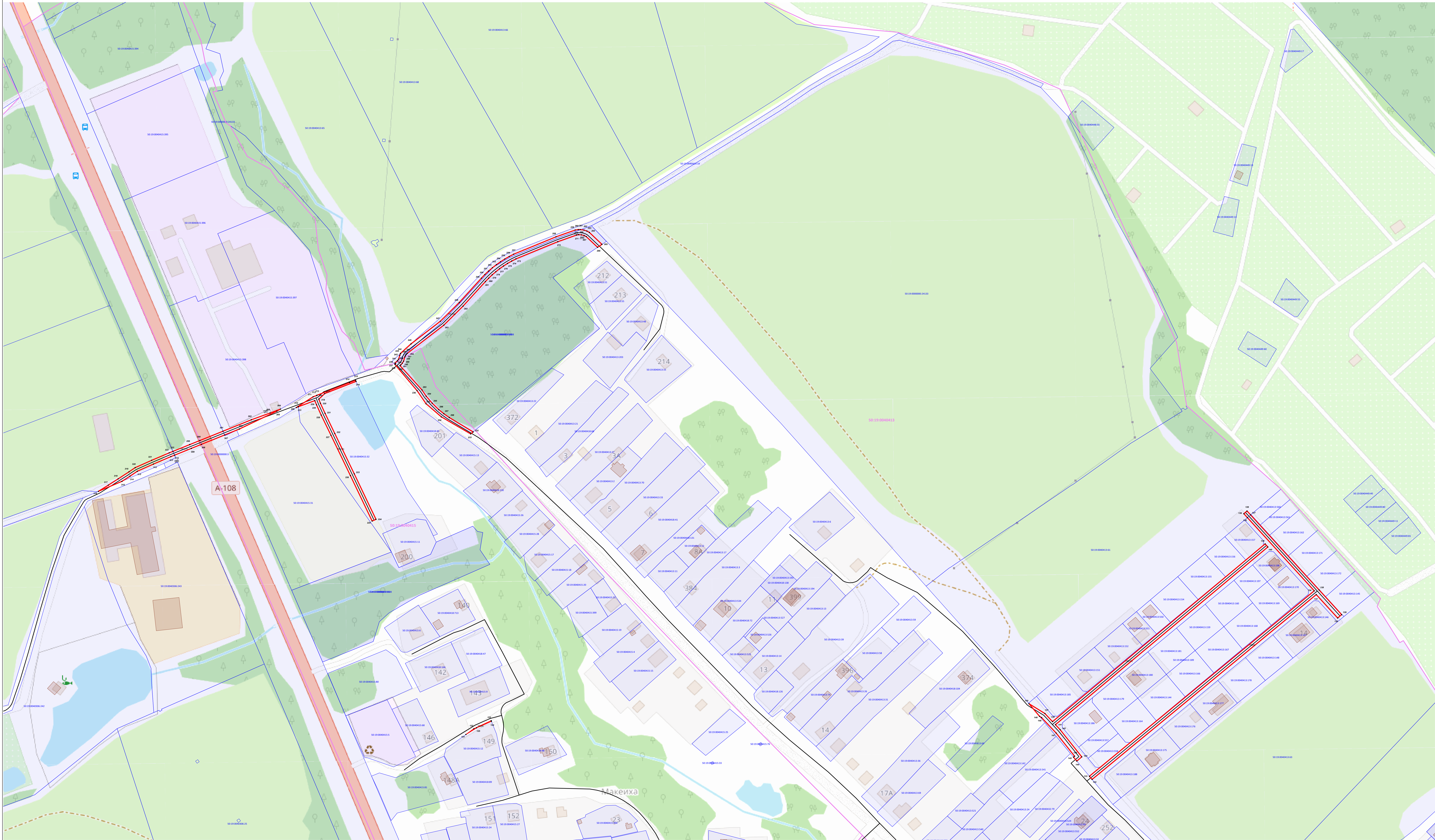
Масштаб 1:1 200